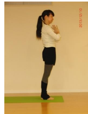
⑫ 吐きながら 元に戻る①へ