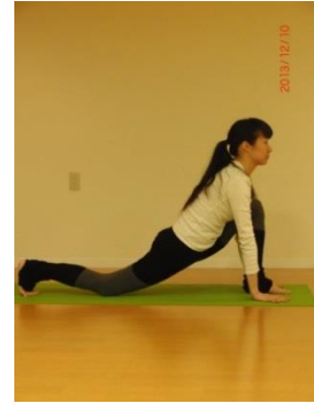
④ 吸いながら ランジを通過