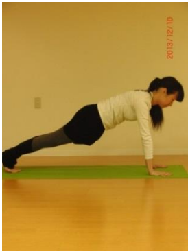
⑤ 引き続き吸いながら プランク