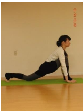
⑨ 吸いながら 手と手の間に ランジを通り 片足ずつ戻す