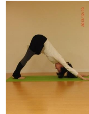
⑧ 吐きながら ダウンドッグ