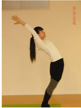
② 吸いながら 伸び