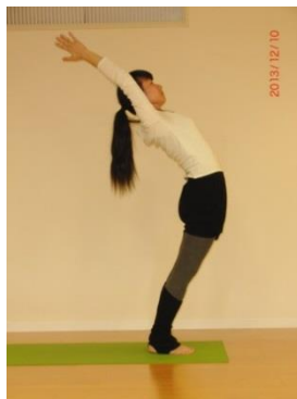
⑪ 吸いながら 伸び