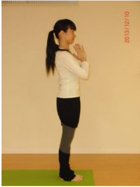
① 両足を揃えて立つ